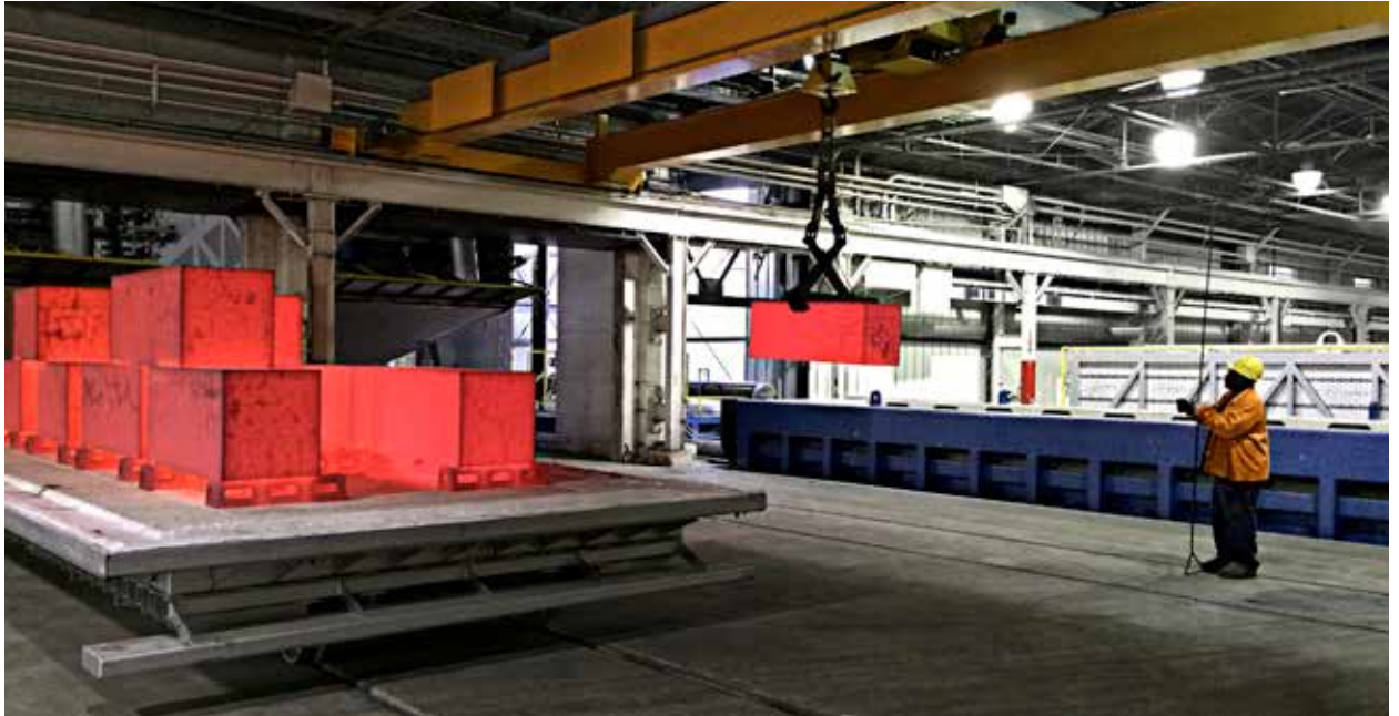
Lean Line bei Finkl Steel in Chicago, USA, vermeidet Arbeitsrückstände und verbessert Lieferzeiten